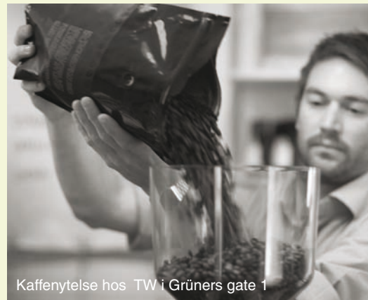
Kaffenyttelse hos TW i Grüners gate 1

www.helios.no Har per 2008 tre avdelinger i Oslo: (1) Helios Colosseum, Middelthushus gate 23, 0367 Oslo. Telefon: 23 20 13 13 Åpningstider: Man-fre 10-18, lør 10-16 (2) Heliosbutikken, Colbjørnsensgt. 12, 0256 Oslo. Telefon: 22 56 32 90 Åpningstider: Man-fre 10-18, lør 10-16 (3) Helios Grünerløkka, Hausmanns gate 10, 0182 Oslo. Telefon: 22 11 33 75 Åpningstider: Man-fre 10-18, lør 11-17 Helios representerer den gamle garde innen økologiske og biodynamiske dagligvarer (ikke bare mat), men har vært gjennom en vanskelig periode med konkurs i april 2008. Selskapet er imidlertid blitt kjøpt opp, og en rekke av butikkene drives videre, i tillegg til at det drives grossistvirksomhet med salg i andre økobutikker og helsekostbutikker. Colosseum-avdelingen har det mest komplette utvalget av de tre.